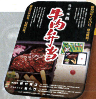
オプションの「あら竹 特選牛肉弁当」