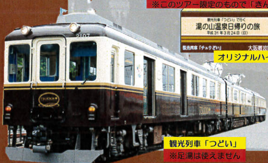
観光列車「つどい」 ※足湯は使えません