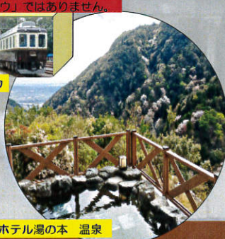
ホテル湯の本 温泉