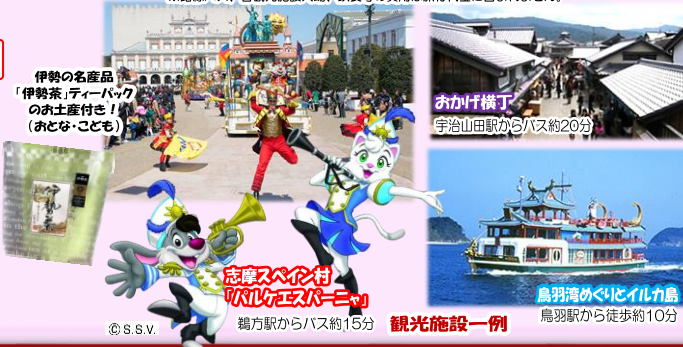
伊勢の名産品 「伊勢茶」(ティーバック) のお土産付き! (おとな・子ども)

※フリー区内で特急列車をご利用の場合は、別途特急券が必要です。 ※路線バス、各観光施設入場、飲食等の費用は旅行代金に含まれません。