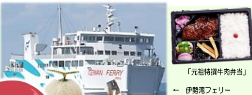
「元祖特撰牛肉弁当」