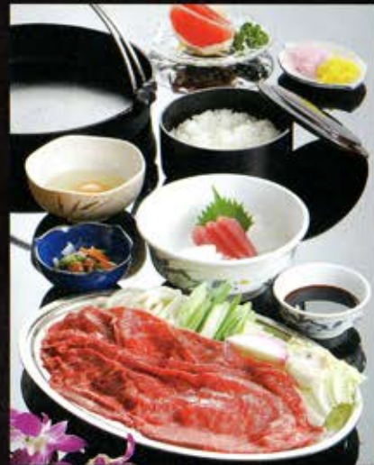
B 松阪の黒毛和牛すき焼膳