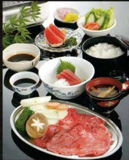
A 松阪の黒毛和牛あみ焼膳

あら竹の創業は明治28年。以来どんなに時代が変わろうと、がんこ一徹、手作りにこだわり、皆様の旅の思い出となる味を守り続けております。名産松阪の牛肉の味わいを、たっぷりご堪能ください。