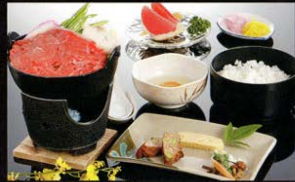
D 松阪の黒毛和牛肉なべ膳

あら竹では40数年間変わらず、松阪が誇る老舗精肉店より、新鮮で確かなお肉だけを厳選して仕入れています。美味しさはもちろん、安全にも絶対的な自信を持っております。