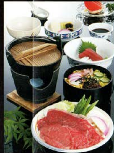
E 松阪の黒毛和牛霜ふりちらし膳